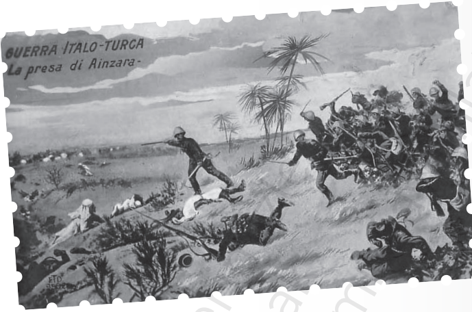
Trablusgarp Savaşı'nu resmeden bir kartpostal

Hatırada döneme ait çok önemli bilgiler ve tespitler yer almaktadır. Bize göre bunlardan en ilginç, Osmanlı devlet kademelerindeki gruplaşmalar nedeniyle tercihlerinde ülkeden ziyade partileri lehine karar vermeleridir. Yazar bu konuda şunlara değinmektedir: