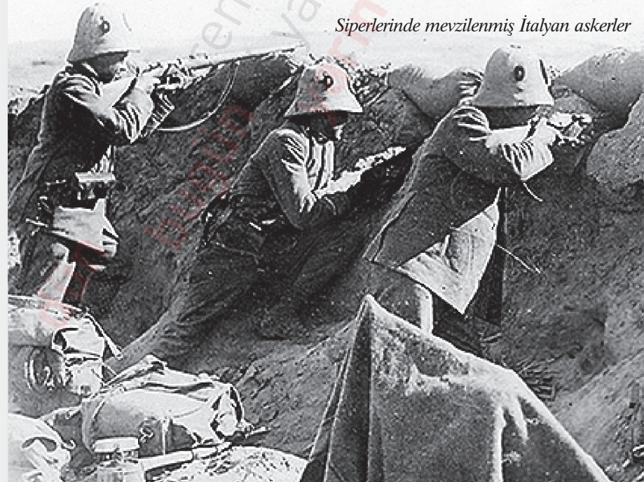
Siperlerinde mevzilenmiş İtalyan askerler

Bunun üzerine General Caneva, harbin çok ağır devam ettiğini izah etmek üzere Kaymakam Giardino'yu Roma'ya göndermişti. Sonra 7 ve 8 Şubat tarihlerinde bizzat kendisi de Roma'ya geldi. General ile uzun mülâkat yaptım. Bu mülâkatlar ben de general hakkında gayet iyi intibalar bıraktı. Kendisinin zeki, muktedir ve intizamı sever bir adam olduğu ve bir işe, ancak onun bütün icabâtını iyice düşünüp tartmadıkça girişmek âdeti olmadığı anlaşılıyordu. Fakat general aynı