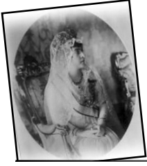
Dokuzuncu Bölüm Bir Portre: Âdile Sultanefendi